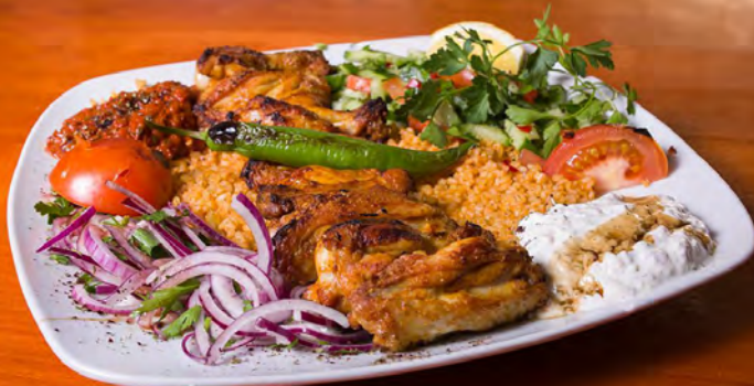
40. Tavuk Kanat