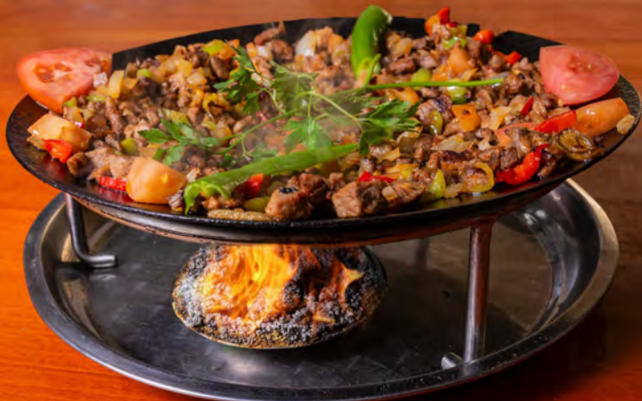
48. Hindi Saç