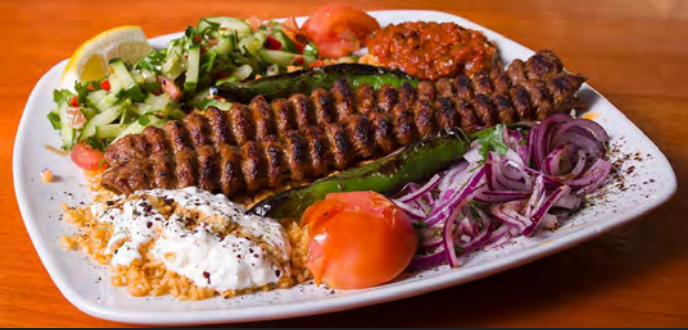
35. Adana Kebab