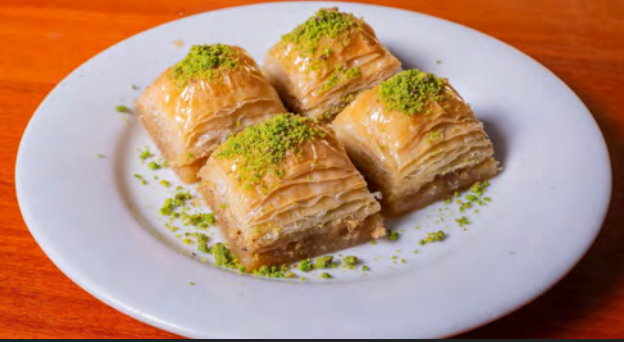
55. Baklava a, c, g, h 5.00 €