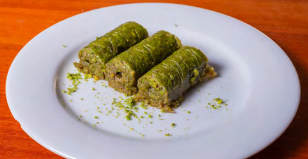
56. Fıstıksarma a, c, g, h 6.00 €