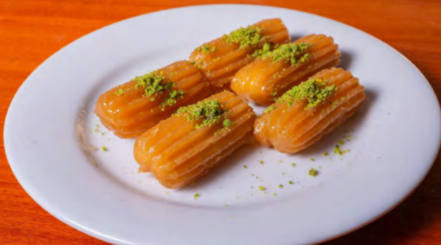
55. Tulumba a, c, g, h 5.00 €