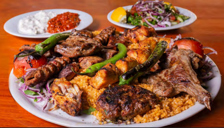
45. Yüksel Grill Teller