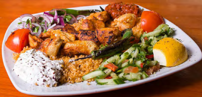
38. Tavuk Şiş