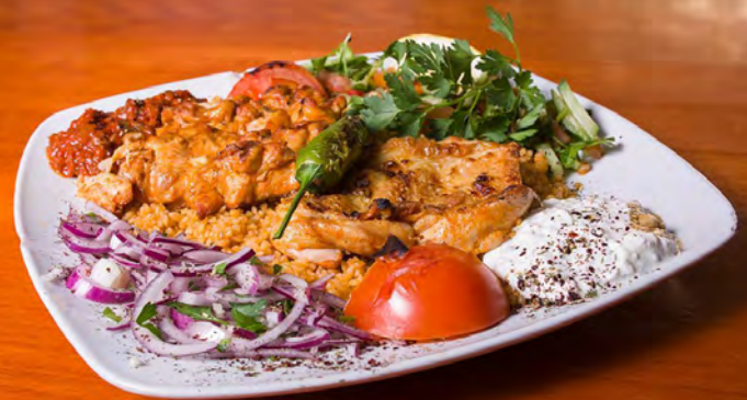
39. Tavuk Pirzola