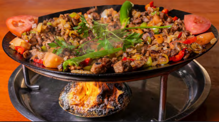
46. Kuzu Saç