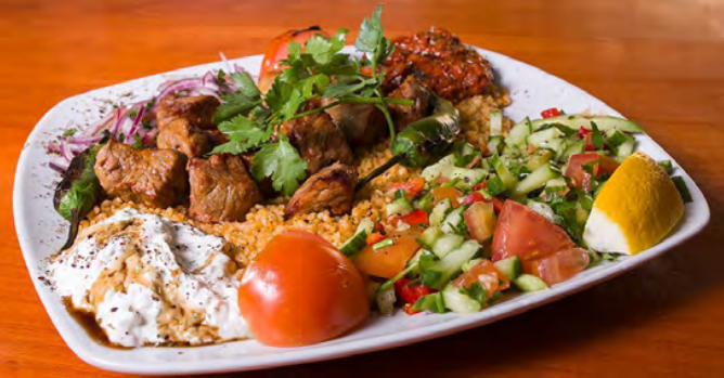
37. Dana Şiş