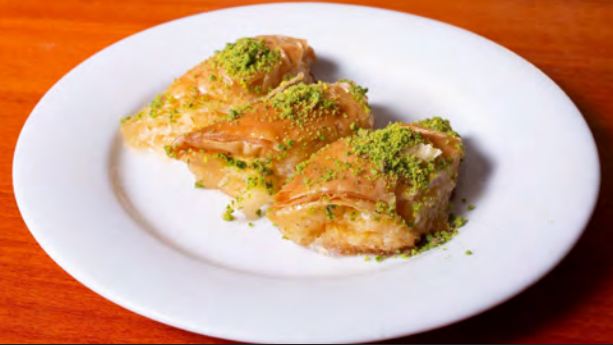
55. Şöbyet a, c, g, h 5.00 €