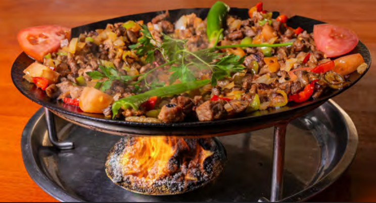
47. Dana Saç