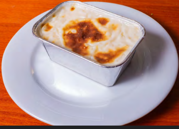
50. Fırın Sütlaç 4.00 €