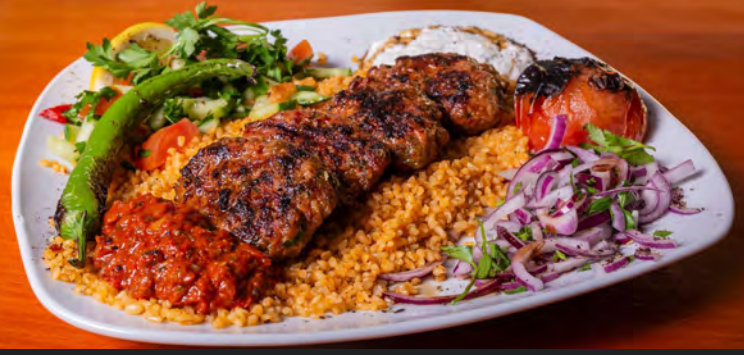
43. Izgara Köfte