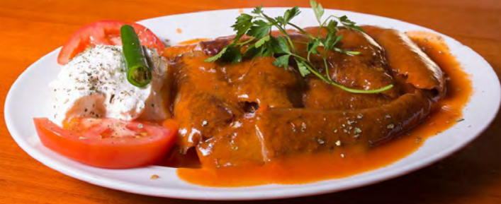
44. İskender Kebab