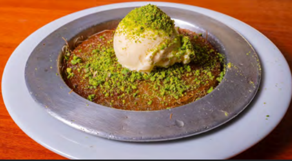
52. Künefe Dondurmalı a, c, g, h 8.00 €