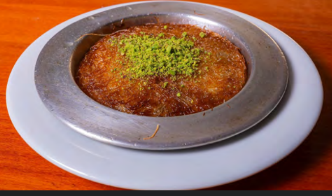
51. Künefe sade 7.00 €