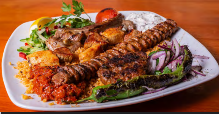
42. Karışık Izgara