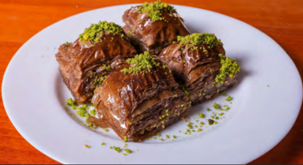
55. Şoko Baklava a, c, g, h 5.00 €