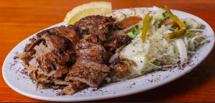
34. Döner Kebab